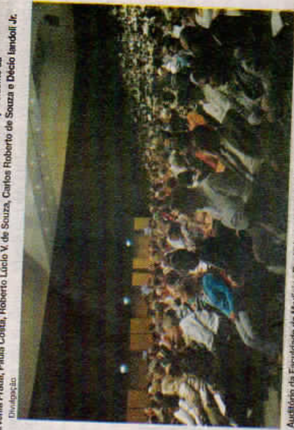
Audatório da Faculdade de Medicina Dentária, que recebeu mais de 800 pessoas durante as III Jornadas